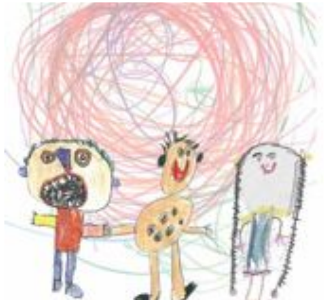
Govven: Sárgun 4 mánáidgárdemánat Guovdageinnus, 2010