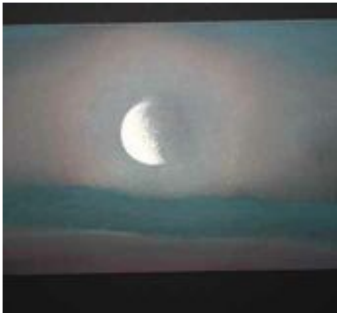
Govven: Kirsti Riesto