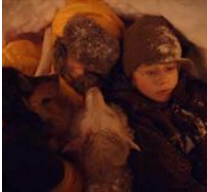
Goven: SEG Distribusjon