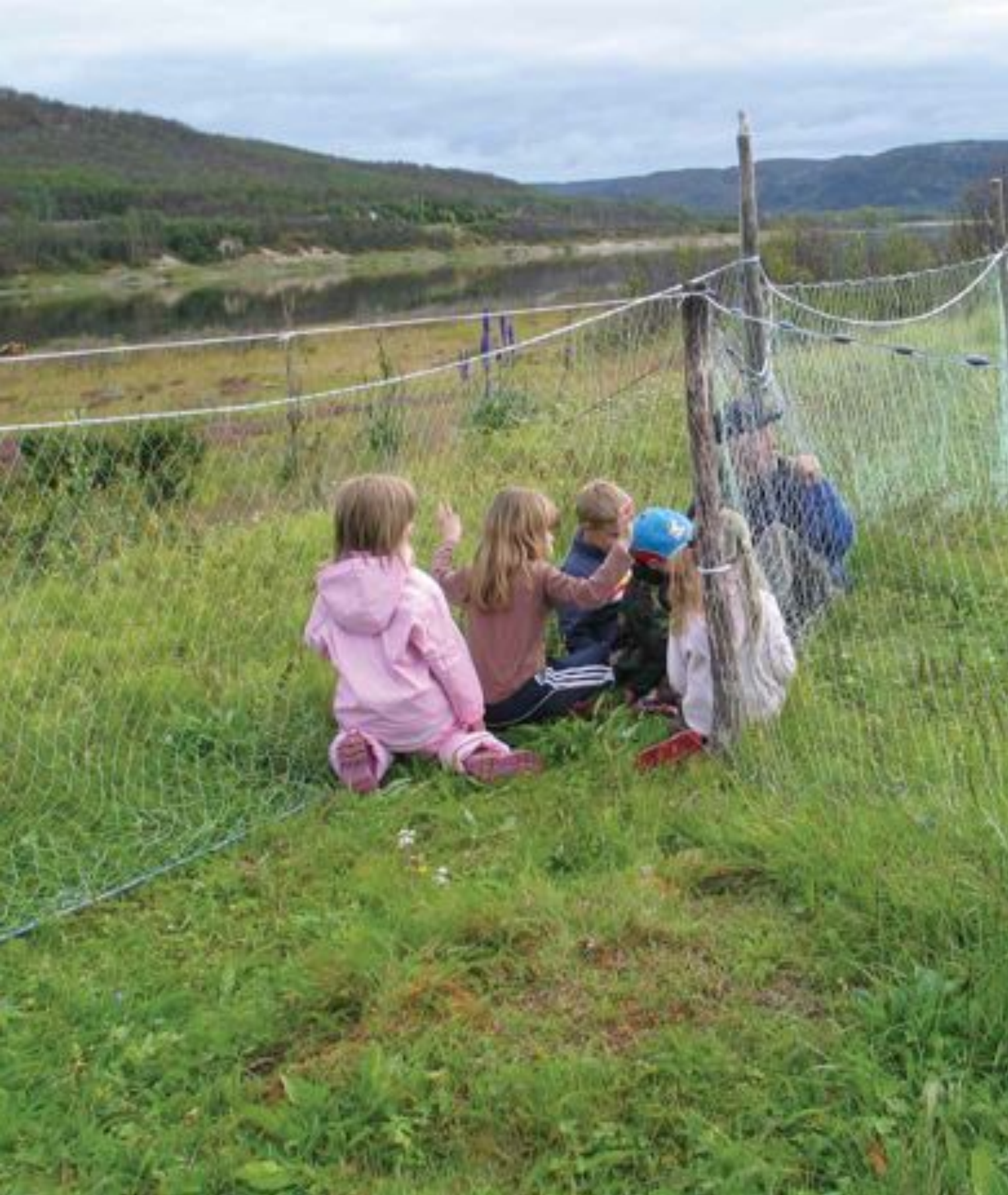
Gowen: Tana Museum