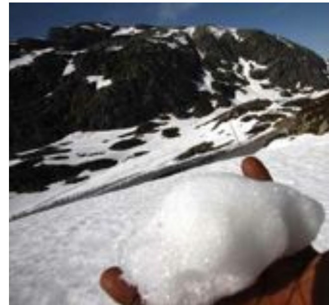
Govven: George Osodi