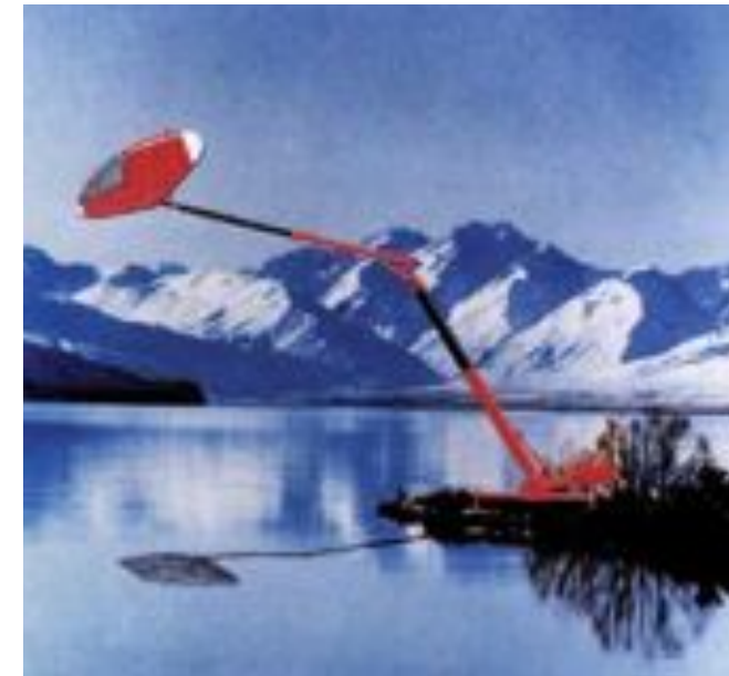
Govva: Peanut House Illustrašuvdna, Future Systems

Ulbmiljoavku: 6.luohkká Giellat: Gámgaviika, Kárášjohka, Guovdageaidnu, Dav- vesiida ja Porsángu Áigodat: Čakčat 2010