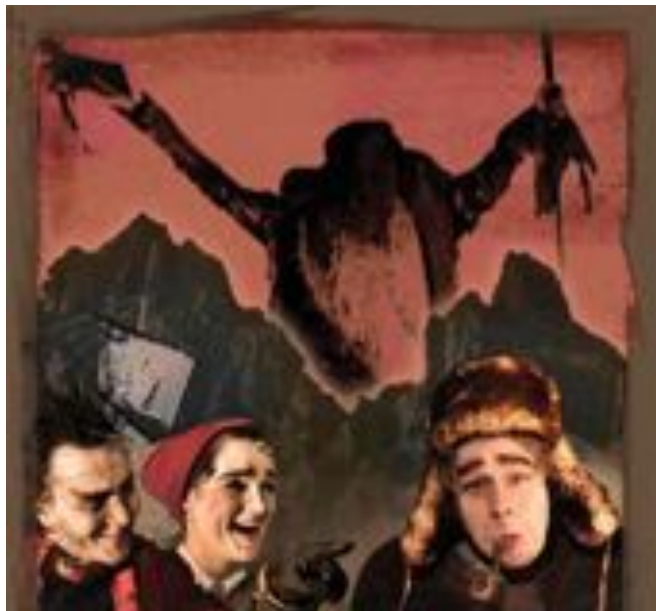
Illustrašuvdna: Reiner Schauffler