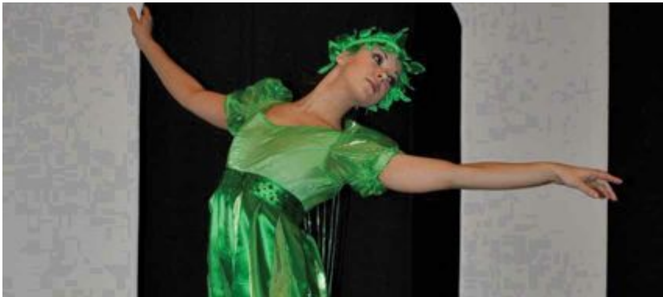
Čájálmasas Spindelvejenta.