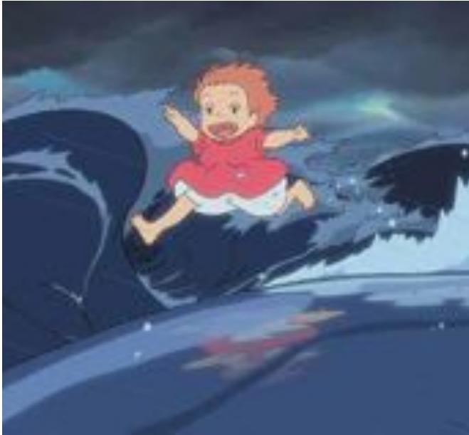
Illustrašuvdna: Oro Film