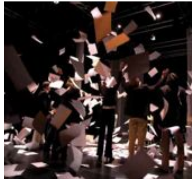
Čájálmasas Arctic Voices . Govven: Lene Stavå