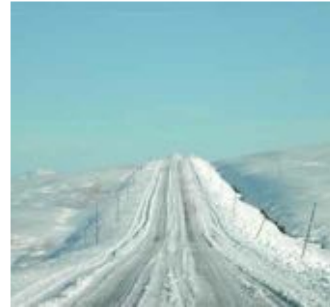
Govven: Mikkel Bugge